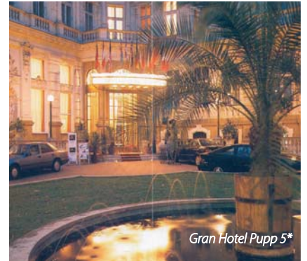
Gran Hotel Pupp 5*